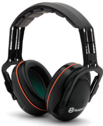
GEHÖRSCHUTZ 505 66 53-04