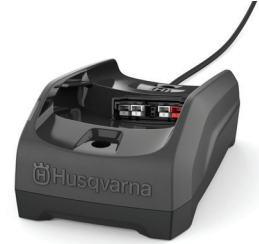
AKKULADEGERÄT C80 (80 W/230 V) 970 48 78-01