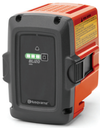
AKKU BLI20 (146 WH) 967 09 17-01