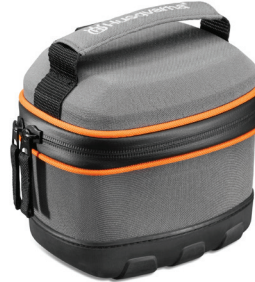
HUSQVARNA AKKUTASCHE 585 37 18-01