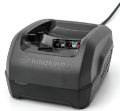
AKKU-SCHNELLDEGERÄT QC250 (250 W/230V) 967 97 01-01