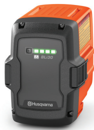
AKKU BLI30 (270 WH) 967 93 77-01