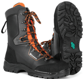
LEDERSCHUTZSTIEFEL MIT SÄGESCHUTZ, CLASSIC 597 65 94-42