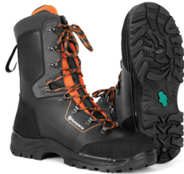
LEDERSCHUTZSTIEFEL MIT SÄGESCHUTZ, CLASSIC 597 65 94-39