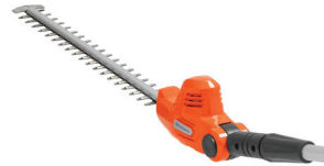
HUSQVARNA HECKENSCHERENVORSATZ HK4 529 35 19-02