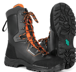
LEDERSCHUTZSTIEFEL MIT SÄGESCHUTZ, CLASSIC 597 65 94-47