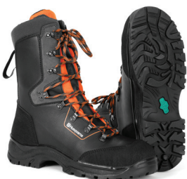
LEDERSCHUTZSTIEFEL MIT SÄGESCHUTZ, CLASSIC 597 65 94-46