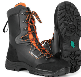
LEDERSCHUTZSTIEFEL MIT SÄGESCHUTZ, CLASSIC 597 65 94-44