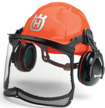
FORSTHELM CLASSIC 580 75 43-01