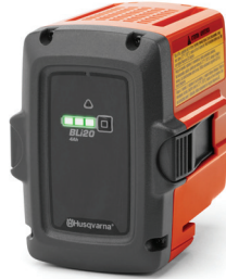
AKKU BLI20 (146 WH) 967 09 17-01