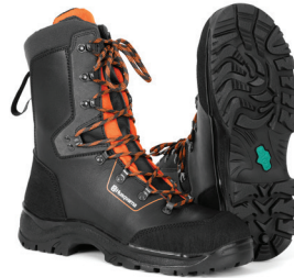
LEDERSCHUTZSTIEFEL MIT SÄGESCHUTZ, CLASSIC 597 65 94-40