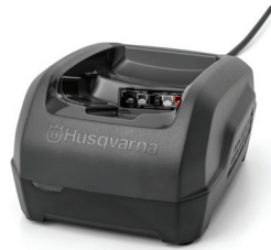
AKKU-SCHNELLADGERÄT QC250 (250 W/230V) 967 97 01-01