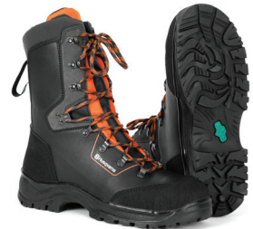
LEDERSCHUTZSTIEFEL MIT SÄGESCHUTZ, CLASSIC 597 65 94-45