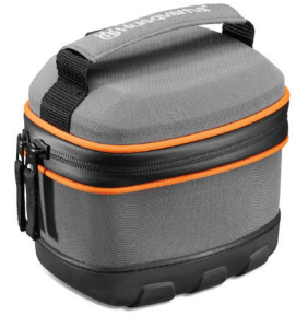
HUSQVARNA AKKUTASCHE 585 37 18-01