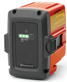
AKKU BLI10 (75,6 WH) 967 09 16-01