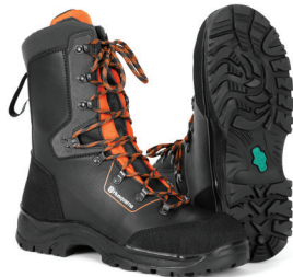
LEDERSCHUTZSTIEFEL MIT SÄGESCHUTZ, CLASSIC 597 65 94-43