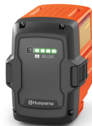
AKKU BLI30 (270 WH) 967 93 77-01