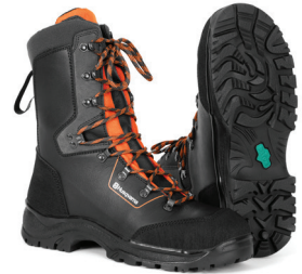
LEDERSCHUTZSTIEFEL MIT SÄGESCHUTZ, CLASSIC 597 65 94-41